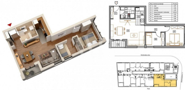
Dvoiposoban stan – 53.56m 2