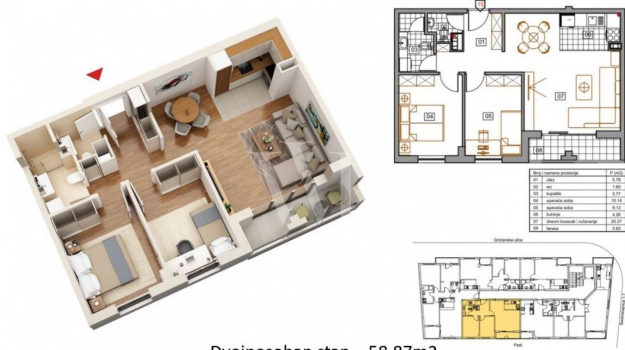
Dvoiposoban stan – 58.87m 2